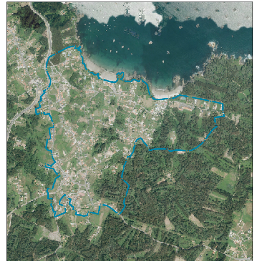
Delimitación do PEPOID / Delimitación del PEPOID