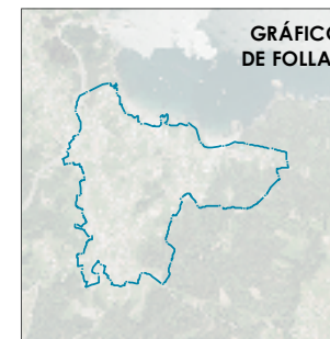
GRÁFICO DE FOLLAS

SX: Sistema xeral / SG: Sistema xeral SL: Sistema local / SI: Sistema local DPv: dotación privada / DPv: dotación privada EL: espazo libre e zonas verdes / EL: espazo libre e zonas verdes EQ: equipamientas / EQ: equipamientas IC: infraestruturas de comunicación / IC: infraestruturas de comunicacións IS: infraestruturas de servizos / IS: infraestruturas de servizos Ob: Obter / Ob: Obterner Ex: existente / Ex: existente