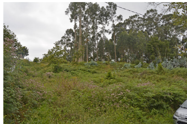
Vista do exterior na banda LSL, coa caída do terraplén cara a liña de foxo.

Ob: Obter / Ob: Obtener Ex: existente / Ex: existente