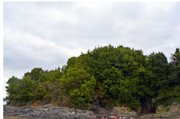
Vista xeral do xacemento dende Oeste.