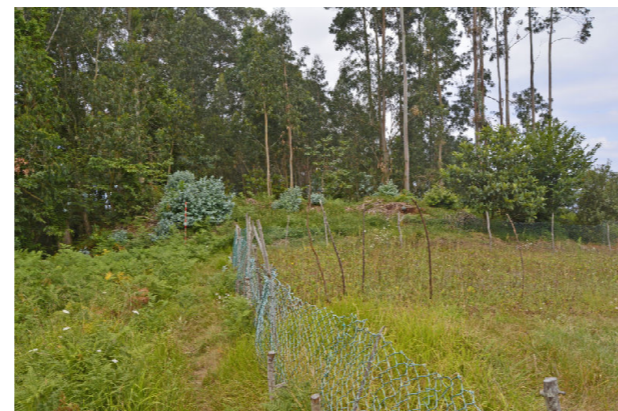
Exterior do xacemento na banda S, coa cara externa da muralla e fincas de labor que tapan o foxo.