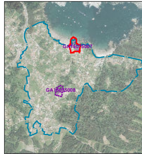
Delimitación do PEPOID / Delimitación del PEPOID