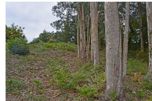
Interior do xacemento e cara interna da muralla no sector S.