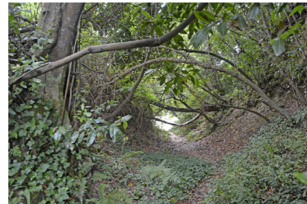
Interior actual do foxo, co xacemento á dereita. Vista dende Este.