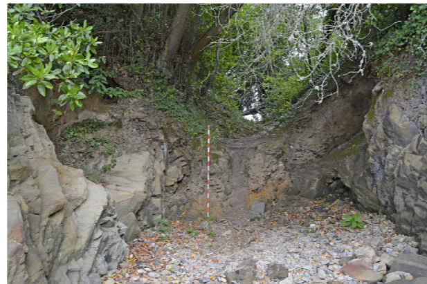
Extremo O do foxo, cortado na rocha e recheo en parte.