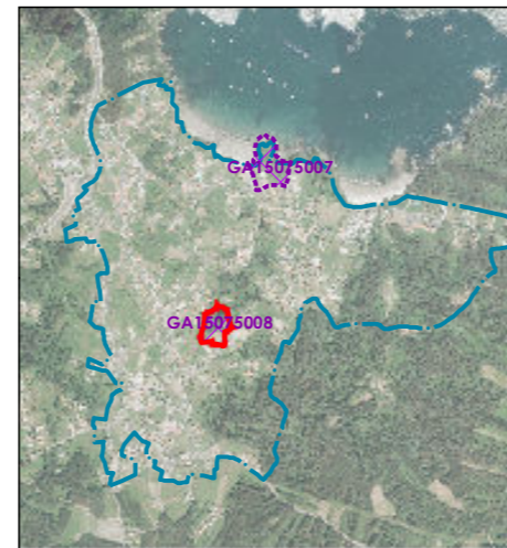
Delimitación do PEPOID / Delimitación del PEPOID